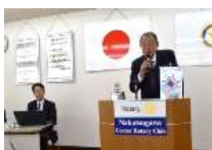
卓話者紹介： 丸山プログラム委員長