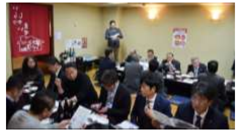
忘年例会 南会長挨拶