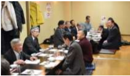
例会開始前の様子