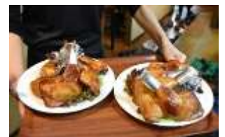
今夜はクリスマスイヴイヴ