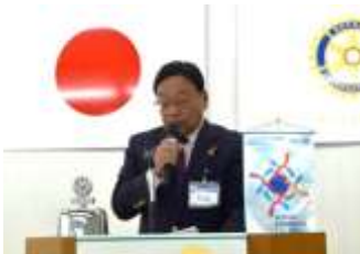
会長の時間：南会長