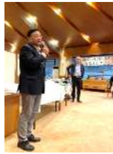
次回ホストクラブ 中津川センターRC 南会長挨拶