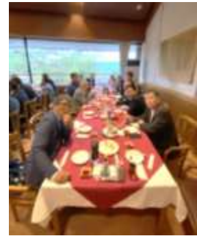
次回は4月頃に開催。