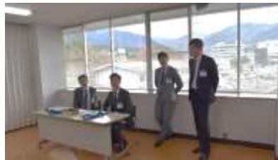
スマイル受付（親睦活動委員会）