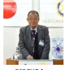
卓話者紹介： 丸山プログラム委員長