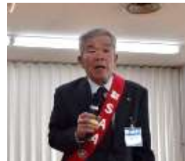
安藤副SAA「例会当番について」