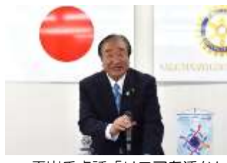
平岩氏卓話「リニアを活かしたまちづくり リニア活用の進捗について」