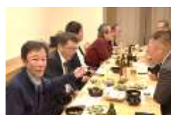
終始和やかな雰囲気