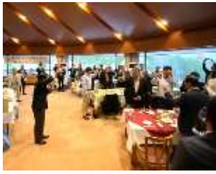
乾杯！お疲れ様でした