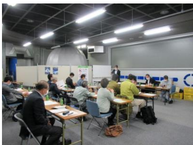
9社の企業様が出席くださいました。

10/29(木) 15:00 子ども科学館会場にて、企画展出展企業説明会が行われました。