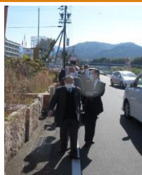
歩いて三菱電機中津川製作所へ