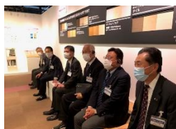
スマートハウス 床暖房 体感中