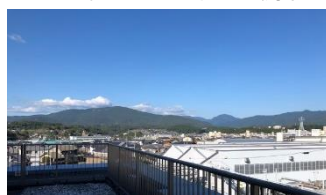
コロナ禍での視察、中津川製作所では万全の予防対策でした。