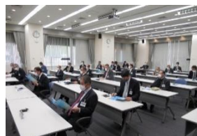
この後3班に分かれ視察