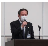
視察後 鷹見会長挨拶