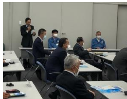
進行: 吉村職業奉仕委員長