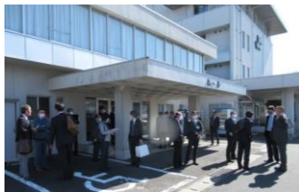
商工会議所前 12:00 集合