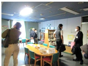
ブース会場になる図書室