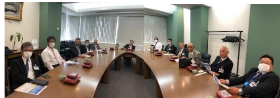
2部屋に分かれて昼食