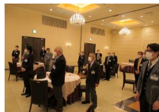
開会点鐘・Rソング