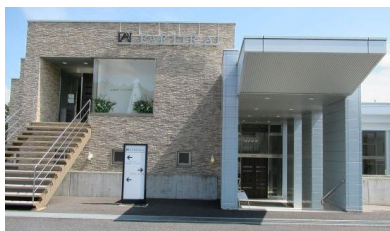
例会場：パルティール AI