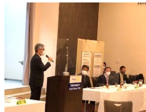
赤座会長よりお礼の言葉