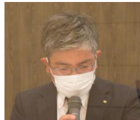
理事会報告：成木幹事 卓話ゲスト紹介：吉村プログラム