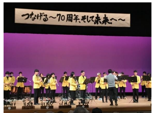
市内高校生によるアトラクション