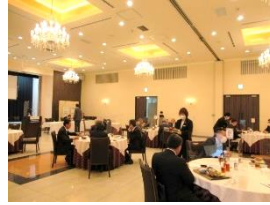
例会前の昼食（黙食）