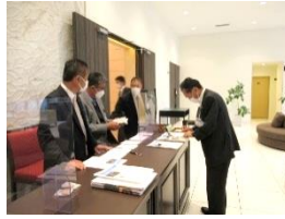
スマイル受付：親睦活動委員会