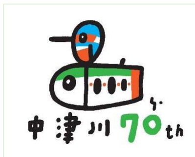
村上康成氏デザイン ロゴ