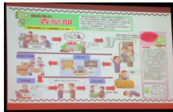
「税務署査察部とは、他」