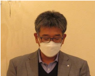
出席報告：板頭親睦委員長