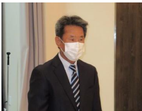
卓話：古川中津川税務署署長