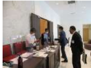
スマイル受付 (親睦活動委員会)