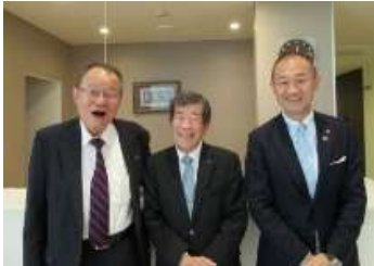
丸山 AG ノミニーと…