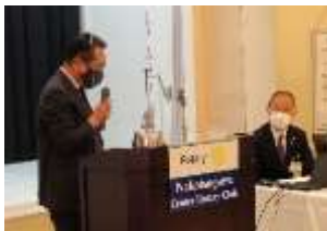
堀会長よりお礼の言葉