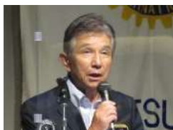
高橋伸治ガバナー