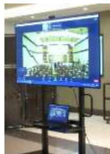
ZOOM 配信 リモート参加も可能に