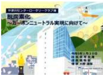
脱炭素化とは？「2050年カーボンニュートラル宣言」他