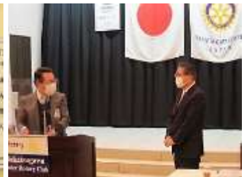
堀会長より卓話のお礼