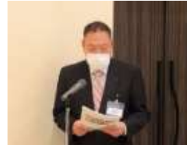
小木曾常任委員長より 2/14 I DM開催のご案内