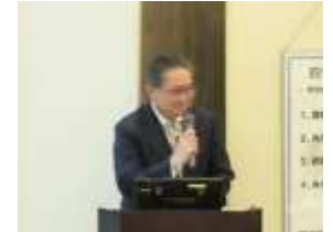
題「カーボンニュートラル実現にむけて」