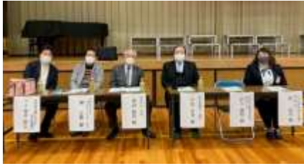
堀会長、荒井幹事、市長、県議と並んで