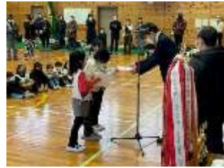
表彰式：優勝 南小4年