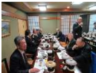
丸山パスト会長より乾杯の発声