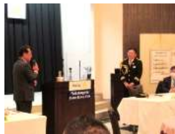
消防団員は仕事をもちながら活動しています。ご支援とご協力をお願い致します。 堀会長より卓話のお礼