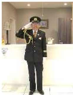
消防団長の制服でお越しくださいました。