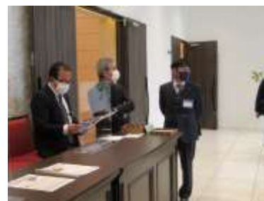
受付：親睦活動委員会