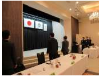
ロータリーソング「我等の生業」