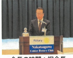
皆出席表彰：バッジ贈呈