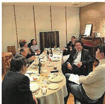
12月2日 第2回IDM (アニーホール)