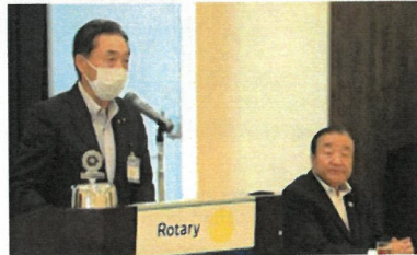
吉村プログラム委員長より、 卓話者、平岩正光県議のご紹介