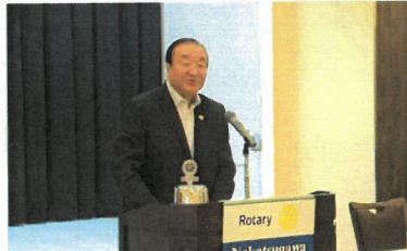
卓話の時間：平岩正光 岐阜県議会議員