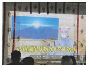
YouTube 狛まる：恵那神社を紹介