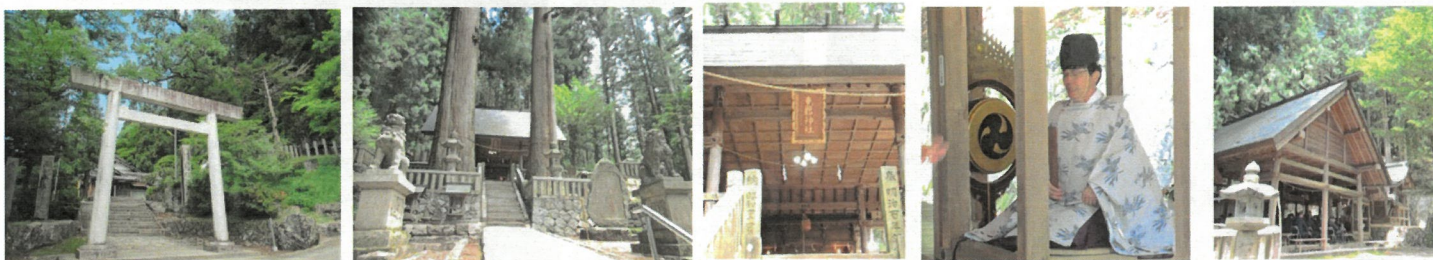
パワースポット恵那神社