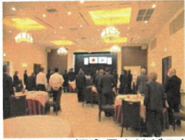
堀会長よりゲスト紹介：平岩正光県議会議員