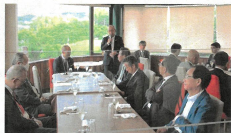
各クラブ会長挨拶