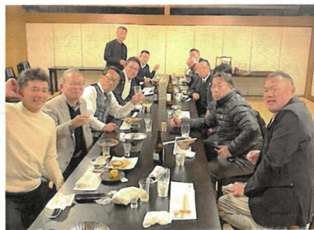
2月14日 第3回IDM (勝宗)