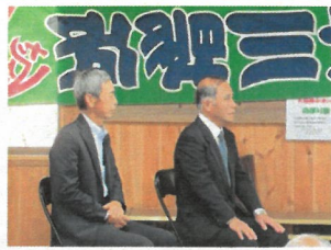
梅村宮司挨拶並びに卓話の時間