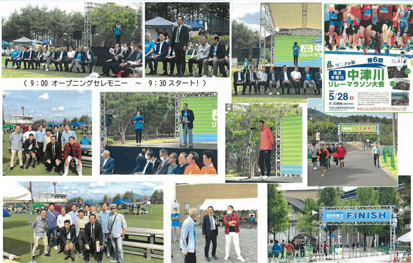
〈 9:00 オープニングセレモニー ~ 9:30 スタート! 〉