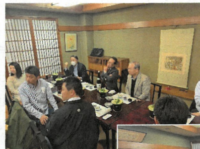
4月24日 第4回IDM (更科)