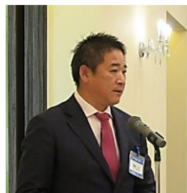
棚橋君「同好会コンペにご参加ください」