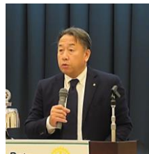
会長の時間：郷原会長