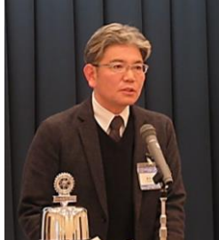
成木常任委員長より卓話者紹介