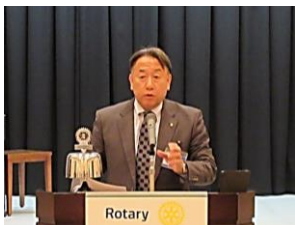
会長の時間：郷原会長