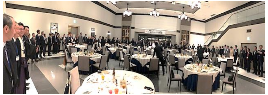
懇親会開場：ソング「手に手つないで」