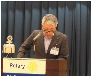
「定時総会」：前期河村幹事より決算報告