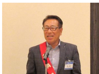
委員会報告：堀 SAA より クールビズ服装について