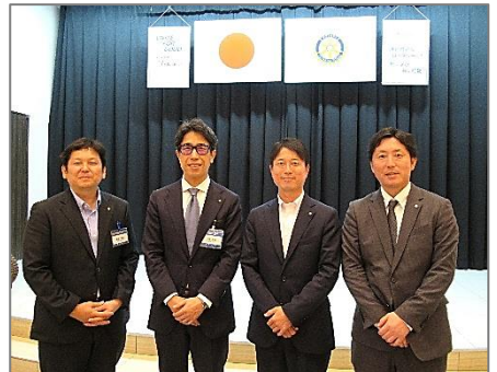
例会終了後 新入会員と会長、幹事