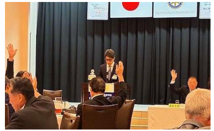
審議可決 総会風景