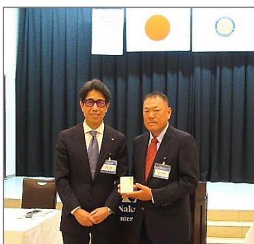
小木曾直前会長へバスト会長バッジ贈呈