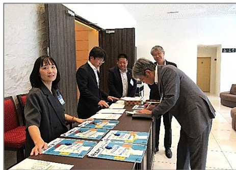
例会受付：親睦活動委員会 会場：パルティール AI